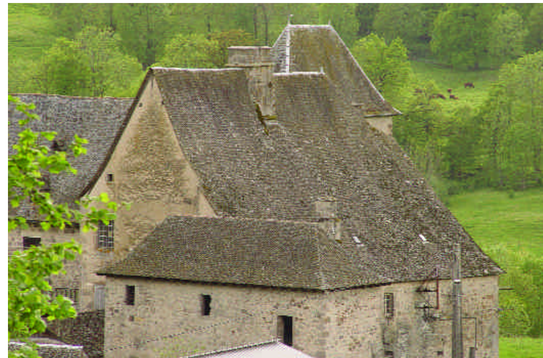
Les toits de Cropières.